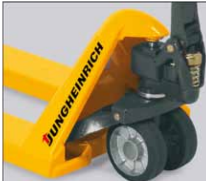
Langtidsholdbar smøring giver en vedligeholdelsesfri indsats.

De kromaterede ledforbindelser og lejrede hjul sikrer en særligt støjsvag gang og en særligt lang holdbarhed. Samlingerne skal ikke smøres, og dog kører AM 20t som smurt.