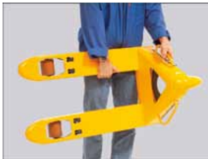
Let at håndtere