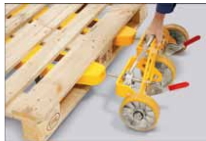
Hjulstøtter til ujævnt underlag

De store hjul i gaffelspidserne sikrer mobilitet og gør, at AM 20t kan køre på stort set ethvert fast men ujævnt underlag. Hjulstøtterne sættes simpelthen ind i de ekstra gaffelforlængere, når håndløftevognen er kørt igennem pallen.