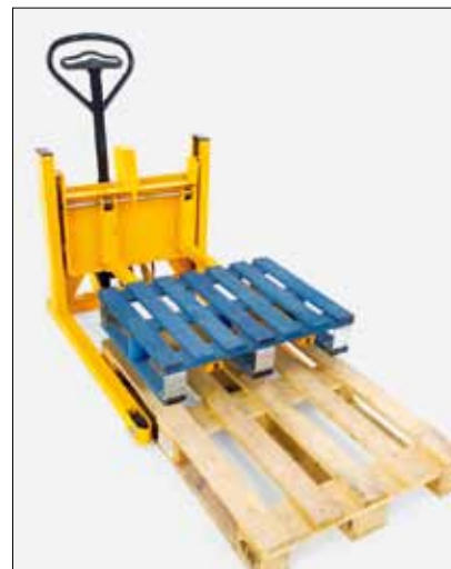
Optagning af en kvartpalle fra en standard europalle