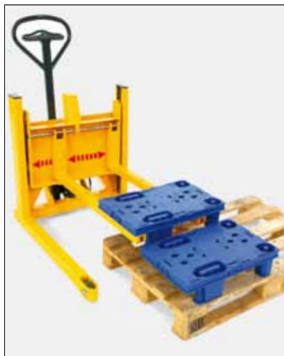
Optagning af en kvartpalle