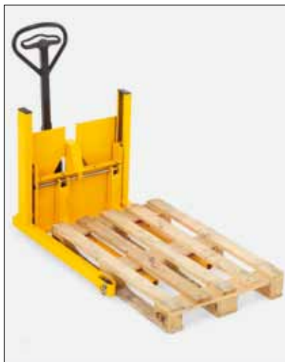
Optagning af en standard europalle