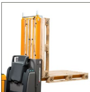
Palleholder til direkte medtagelse af den ekstra palle (tilvalg)