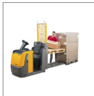
Ergonomisk aflægning af varen