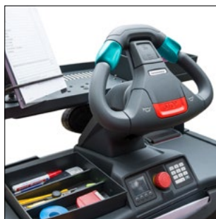
Med variable fralægningsmuligheder kan arbejdspladsen udformes individuelt