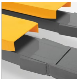
Indkøringshjælp og gaffelmarkering